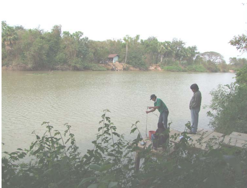
ภาพที่ 8 จุดสำรวจวัดนานุญเฉลิมราษฎร์