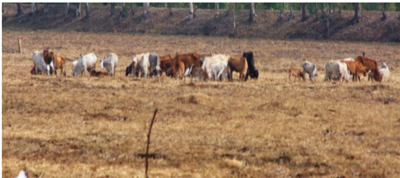
ภาพที่ 12 การใช้ที่ดินด้านเกษตรกรรม (การปลูกสัตว์ - เลี้ยงวัว)